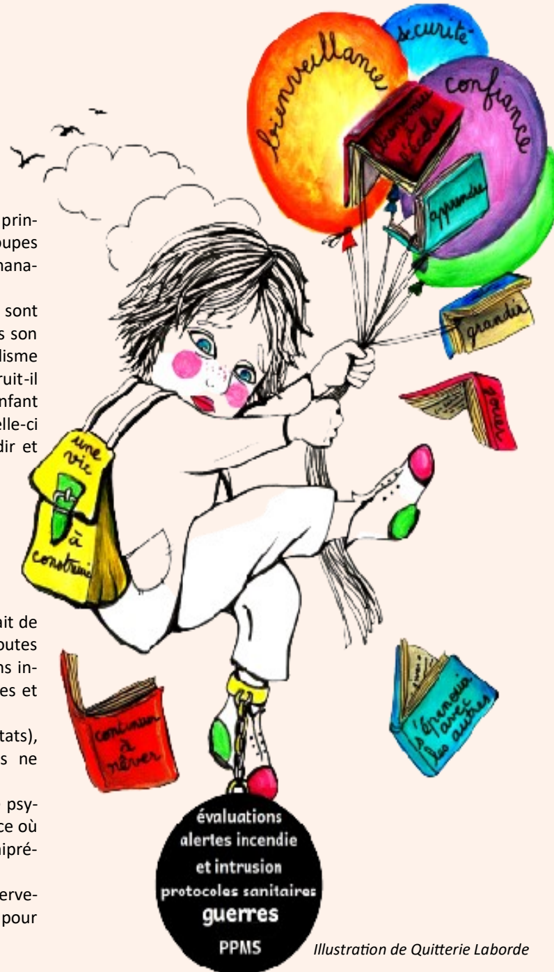
Illustration de Quiterrie Laborde

Cette conférence se propose d'aborder la façon dont les intervenants en milieu scolaire peuvent être des ressources résilientes pour les élèves en leur apportant le minimum de sécurité psychique.